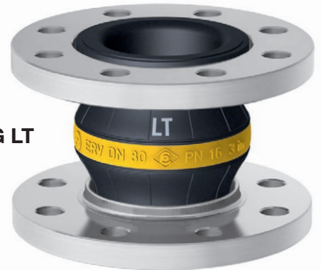
Type ERV-G LT

Innen : NBR (Nitril), nahtlos, abriebfest Druckträger : PA-Textilcord Außen : Chloropren CR Kennzeichnung : Gelber Ring mit weißem 'LT'-Aufdruck, ERV DN .., PN 16, Herstelldatum Flansche 1) : Drehbar, DIN PN 10/16, Stahl, verzinkt